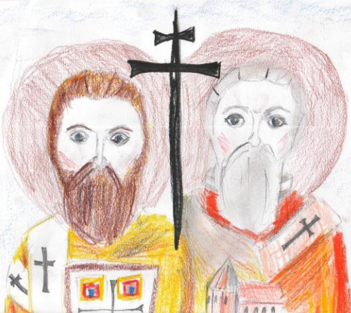
(K. Král'ová, 6. ročník)